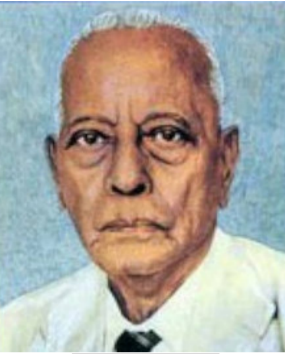
ତିରୋଧାନ ଦିବସ ଅବସରରେ