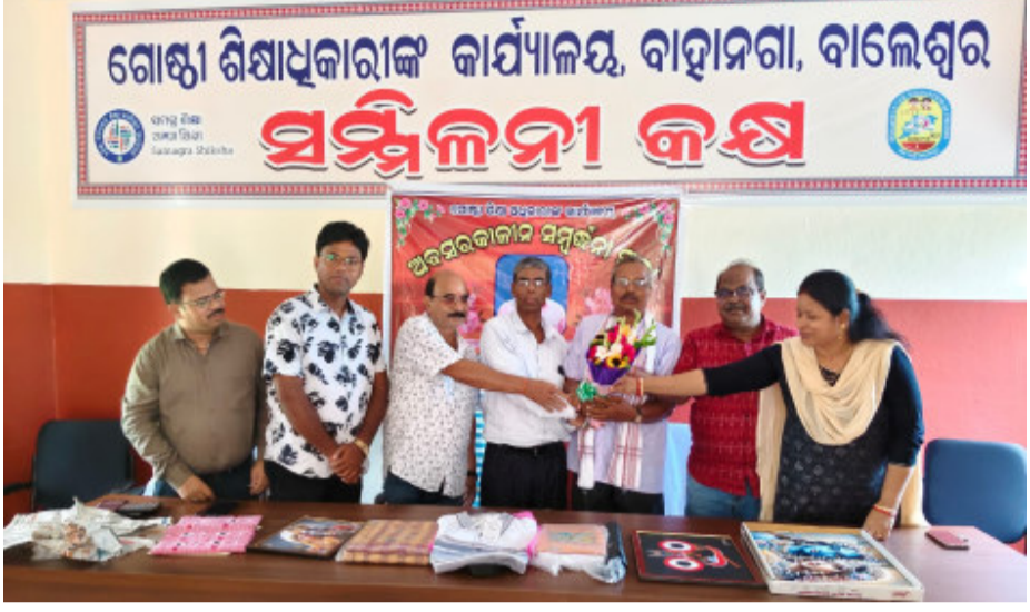
ଗୋଷ୍ଠୀ ଶିକ୍ଷାଧିକାରୀଙ୍କ କାର୍ଯ୍ୟାଳୟ, ବାହାନଗା, ବାଲେଶ୍ୱର ପ୍ରକ୍ରିୟା କ୍ଷୟ