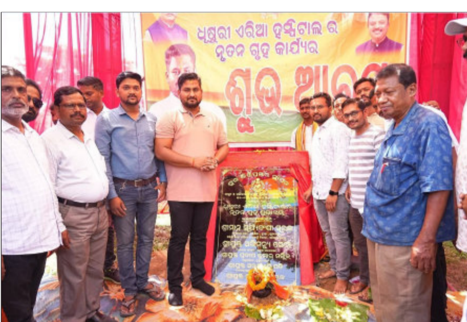
କୋଟି ଟଙ୍କା ମଞ୍ଜୁର ସହିତ ଆନୁଷ୍ଠାନିକ ଟେଣ୍ଡର ବ୍ୟବସ୍ଥା ଅନୁସାରେ ୨.୪୦ କୋଟି ମୂଲ୍ୟରେ କାର୍ଯ୍ୟ ହେବା ନେଇ ପ୍ରକ୍ରିୟାଚଳ ହୋଇଛି । ମଞ୍ଜୁର ଅର୍ଥରେ ହସ୍ତିଚାଳରେ ପୁରୁଷ ଓ ମହିଳା ରୋଗୀଙ୍କ ପାଇଁ ପୃଥକ ଷ୍ଟାଣ୍ଡ ସମେତ ଅନ୍ୟାନ୍ୟ ଆନୁଷ୍ଠାନିକ ନିର୍ମାଣ ଯୋଜନା

ଧାମନଗର(ନିପ୍ତ): ଧାମନଗର ରୁକ୍ମିଣୀ ଏରିଆ ହସ୍ତିଚାଳ ରୂପରେଖ ବଦଳିବ । ଜାତୀୟ ସ୍ୱାସ୍ଥ୍ୟ ମିଶନ ପକ୍ଷରୁ ୩ କୋଟି ଟଙ୍କାର ଆର୍ଥିକ ସହାୟତା ମଞ୍ଜୁର କରାଯାଇଛି ଏବଂ ପ୍ରକଳ୍ପ ପାଇଁ ଟେଣ୍ଡର ପ୍ରକ୍ରିୟା ଶେଷ ହେବା ପରେ ଶିଳାମାଳା ପାଖରେ ମନ୍ତ୍ରୀଙ୍କ ପ୍ରତିଷ୍ଠା କରାଯାଇଛି । ଧାମନଗର ୧୫ ରୁ ୨୦ ପର୍ଯ୍ୟନ୍ତ ଧାମନଗର ସ୍ୱାସ୍ଥ୍ୟକେନ୍ଦ୍ର ନିର୍ମାଣ ଉପରେ ନିର୍ଦ୍ଦେଶ ଦିଆଯାଇଛି । ମନ୍ତ୍ରୀଙ୍କ ପ୍ରତିଷ୍ଠାରେ ନିକଟରେ ଏହାର ନୂତନ ରୂପରେଖ ପାଇଁ ଯୋଜନା ପ୍ରସ୍ତୁତ କରାଯାଇଥିଲା । ଜାତୀୟ ସ୍ୱାସ୍ଥ୍ୟ ମିଶନ ରେ ଏରିଆ ହସ୍ତିଚାଳର ବିକାଶ କାର୍ଯ୍ୟ ନିମନ୍ତେ ୩