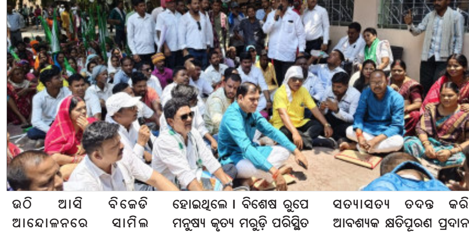
ଉଠି ଆସି ବିଜେଡି ଆନ୍ଦୋଳନରେ ସାମିଲ ହୋଇଥିଲେ । ବିଶେଷ ରୂପେ ମନୁଷ୍ୟ କୃତ ମରୁଡ଼ି ପରିସ୍ଥିତ ସତ୍ୟାସତ୍ୟ ଚଦନ୍ତ କରି ଆବଶ୍ୟକ କ୍ଷତିପୂରଣ ପ୍ରଦାନ

ଦୁଆପଡ଼ା(ନିପ୍ତ): ବିଜେଡି ପକ୍ଷରୁ ପଡ଼ୋର ଅପର ଯୋଜ୍ଞ କଳ ସେବନ ପ୍ରକଳ୍ପ କେ କଳ ଆବଂଚନ ସମସ୍ୟା, ମନୁଷ୍ୟକୃତ ମରୁଡ଼ି ସମସ୍ୟା ର ଉପଯୁକ୍ତ କ୍ଷତିପୂରଣ ଦାବା ନେଇ ଜିଲ୍ଲାପାଳ ସଦାକାନ୍ତା ସଭା ଗୃହ ସମ୍ମୁଖରେ ଘେରାଇ ଏବଂ ବିକ୍ଷୋଭ ପ୍ରଦର୍ଶନ କରିଥିଲେ । ଜିଲ୍ଲାପରିଷଦ ବୈଠକ ଅନୁଷ୍ଠିତ ହୋଇଥିବା ବେଳେ ଖଡ଼ିଆଳ ବିଧାୟକ, ବିଜେଡି ସମ୍ପର୍କ ଜିଲ୍ଲା ପରିଷଦ ସଭ୍ୟ ସଭ୍ୟା ମାନେ ବୈଠକ ରୁ