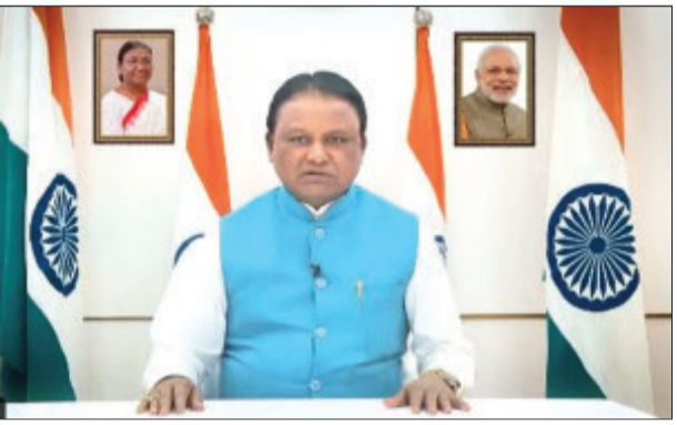
ସେମାନେ ମଧ୍ୟ ଅନୁରୂପ ଭାବେ ମୋଦିଙ୍କୁ ପ୍ରତିଶ୍ରୁତି ଦେଇଛନ୍ତି । ଏହା ଦ୍ଵାରା ରାଜ୍ୟର ପ୍ରାୟ ୨୦ ଲକ୍ଷ କର୍ମଚାରୀ ଓ ସେନୁକୋରୀ ଉପକୃତ ହେବେ ।