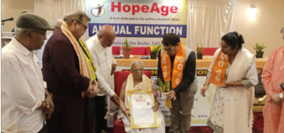
କଟକ(ନିପ୍ର): ବରିଷ୍ଠ ନାଗରିକ ମାନଙ୍କ କଲ୍ୟାଣ ପାଇଁ ସମର୍ପିତ ଅନୁଷ୍ଠାନ 'ହୋପ ଏଜ ଟ୍ରଷ୍ଟ'ର ବ୍ରହ୍ମାଣ୍ଡ ବାର୍ଷିକ ଉତ୍ସବ ମଙ୍ଗଳ ଦିନ ରେକ୍ଡର-୯ ସ୍ଥିତ ରାଜସିନା ସମ୍ମିଳନୀ କକ୍ଷରେ ଅନୁଷ୍ଠିତ ହୋଇ