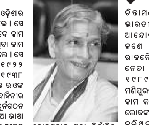
ଲୋକସଭାକୁ ପୁରୀ ନିର୍ବାଚିତ ହୋଇଥିଲେ । ଘରୋଇ ବିଭାଗର ରାଜସ୍ୱମନ୍ତ୍ରୀ, ପ୍ରତିରକ୍ଷା ବିଭାଗର ରାଜସ୍ୱ ମନ୍ତ୍ରୀ ଓ ମଣିପୁରର ରାଜ୍ୟପାଳ ଭାବେ କାମ କରୁଥିଲେ । ରାଜ୍ୟ ଓ ଲୋକଙ୍କ ଉନ୍ନତି ନିମନ୍ତେ ସେ କରିଥିବା କାମ କାରଣରୁ ମଣିପୁରବାସୀ ତାଙ୍କ ଲୋକଙ୍କ ରାଜ୍ୟପାଳ କହୁଥିଲେ । ତତ୍କାଳୀନ ମଣିପୁର ରାଜ୍ୟର ସାମଗ୍ରୀକ ବିକାଶ ପାଇଁ ତାଙ୍କ ଅବଦାନ ଅତ୍ୟନ୍ତ ଉଲ୍ଲେଖନୀୟ ଥିଲା । ସେ ଭାରତର ଓଡ଼ିଶା ପ୍ରଦେଶରେ ଥିବା ବିଶ୍ୱନାଥପୁର ଗ୍ରାମରେ ୧୯୨୨ ମସିହା ମାର୍ଚ୍ଚ ୨୨ ତାରିଖରେ ଜନ୍ମ